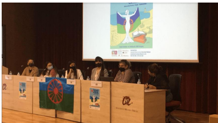
Role model table at the XX RWSG of Catalonia

Η XX Συνάντηση Γυναικών Ρομά της Καταλονίας , που συνδιοργανώθηκε από την DKM και τις γυναίκες Ρομά οι οποίες προέρχονται από λαϊκά στρώματα που συμμετείχαν στην εκδήλωση, πραγματοποιήθηκε στο Πανεπιστήμιο Rovira i Virgili, στην πόλη Tarragona. Στην εκδήλωση, που πραγματοποιήθηκε στις 23 Οκτωβρίου 2021, συμμετείχαν περίπου 250 γυναίκες Ρομά, καθώς και