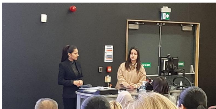
Role Model – Πρώτη Συνάντηση στο Ηνωμένο Βασίλειο

Συνολικά, κατά προσέγγιση 360 γυναίκες έχουν συμμετάσχει στις Συναντήσεις στις χώρες αυτές.