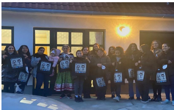
Συμμετέχουσες - I RWSG στην Ουγγαρία

κρατικές αρχές σχετικά με τον τρόπο πρόσβασης σε μια αξιοπρεπή εργασία. Η απόκτηση μιας αξιοπρεπούς εργασίας για τη στήριξη των οικογενειών τους μπορεί να εμποδίσει τις αρχές να απομακρύνουν τα παιδιά από τις οικογένειές τους.