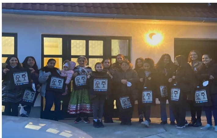
Participantes - I Encuentro estudiantes gitanas de Hungría