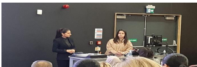
Referente - I RWSG del Reino Unido

En total 360 mujeres se han unido a los Encuentros en todos estos países.