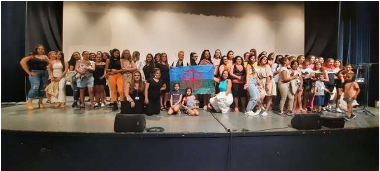
Rromnă k-o XXI-to Kidipen le Rromnănqo Studentură andar e Katalonia

O II-to Raporto vaš o Spaniolo Kidipen. RTransform: Rromnă paruvindoj ol edukacionalo sistemură andar e Europa maškar lenqi mobilizară sočialo haj politiko